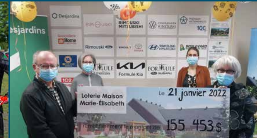
LOTÉRIE MAISON MARIE-ÉLISABETH.