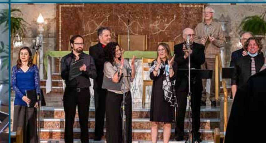
CONCERT DE NOËL.