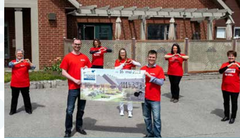
MARCHETHON DE LA DIGNITÉ.