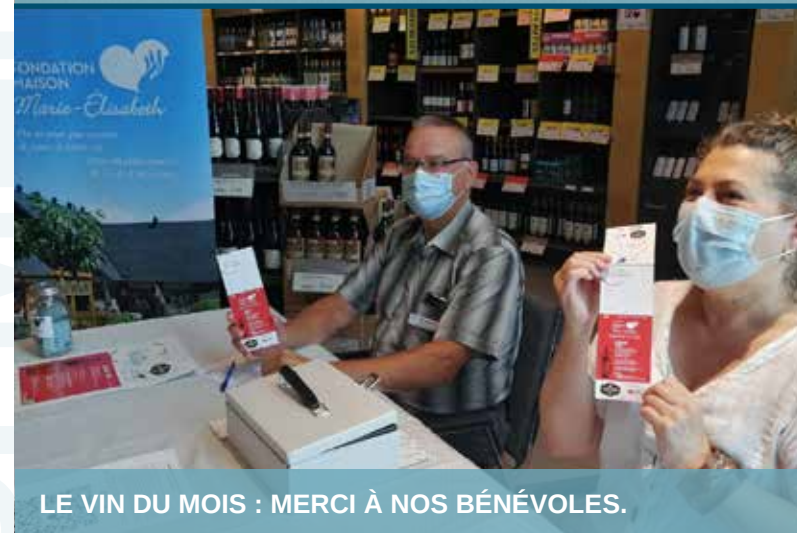
LE VIN DU MOIS : MERCI À NOS BÉNÉVOLES.