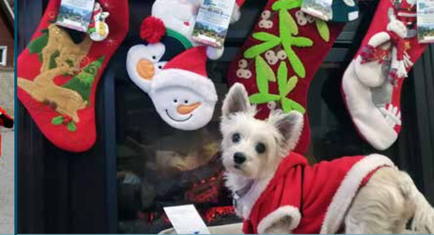
UNE CAMPAGNE DE NOËL QUI A DU CHIEN!