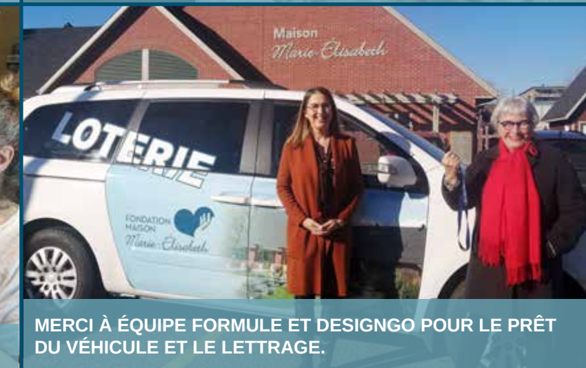
MERCI À ÉQUIPE FORMULE ET DESIGNGO POUR LE PRÊT DU VÉHICULE ET LE LETTRAGE.