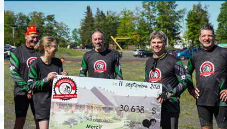
CHALLENGE DE MONTAGNE VPA.